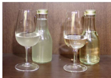
図2 オリ下げ処理の有無によるブレンドワインの外観の差異（左：未処理 右：オリ下げ処理）