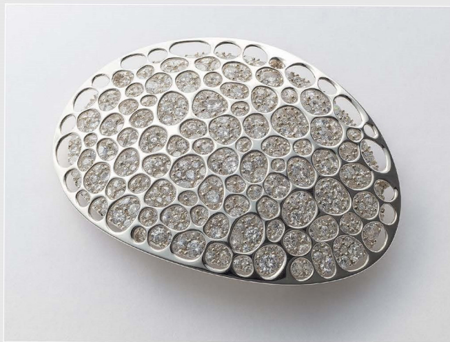
ブローチ「なかみ」 デザイン・制作：森野溪登