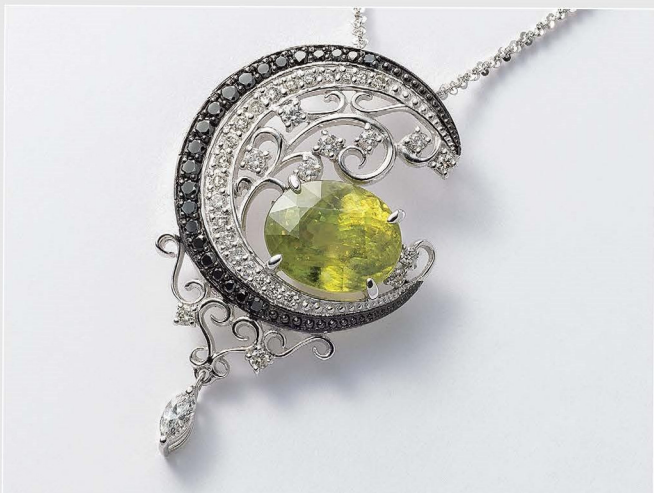
ペンダント デザイン：古屋一樹 制作：oidenatte