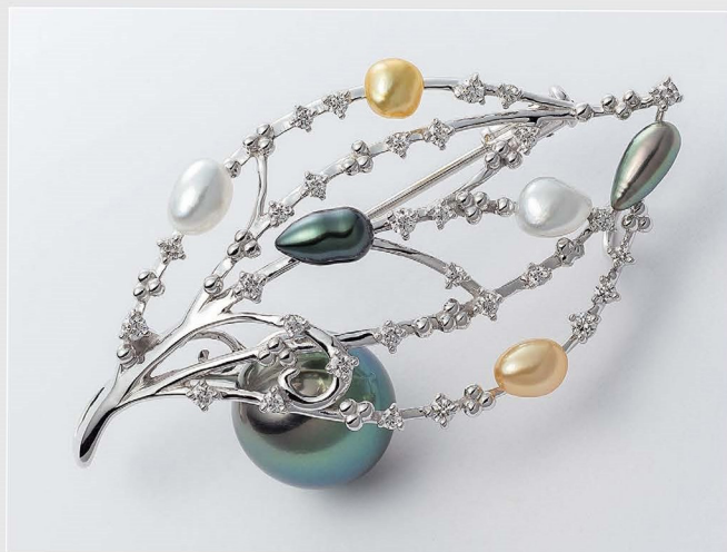
ブローチ・ネックレス デザイン：関戸智美 制作：(株)中込宝飾