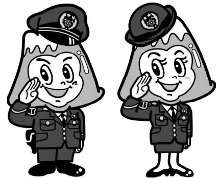
山梨県警察シンボルマスコット