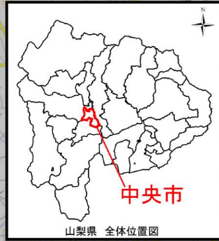
山梨県 全体位置図