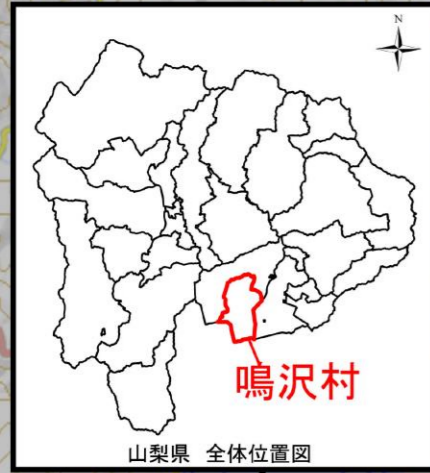
山梨県 全体位置図