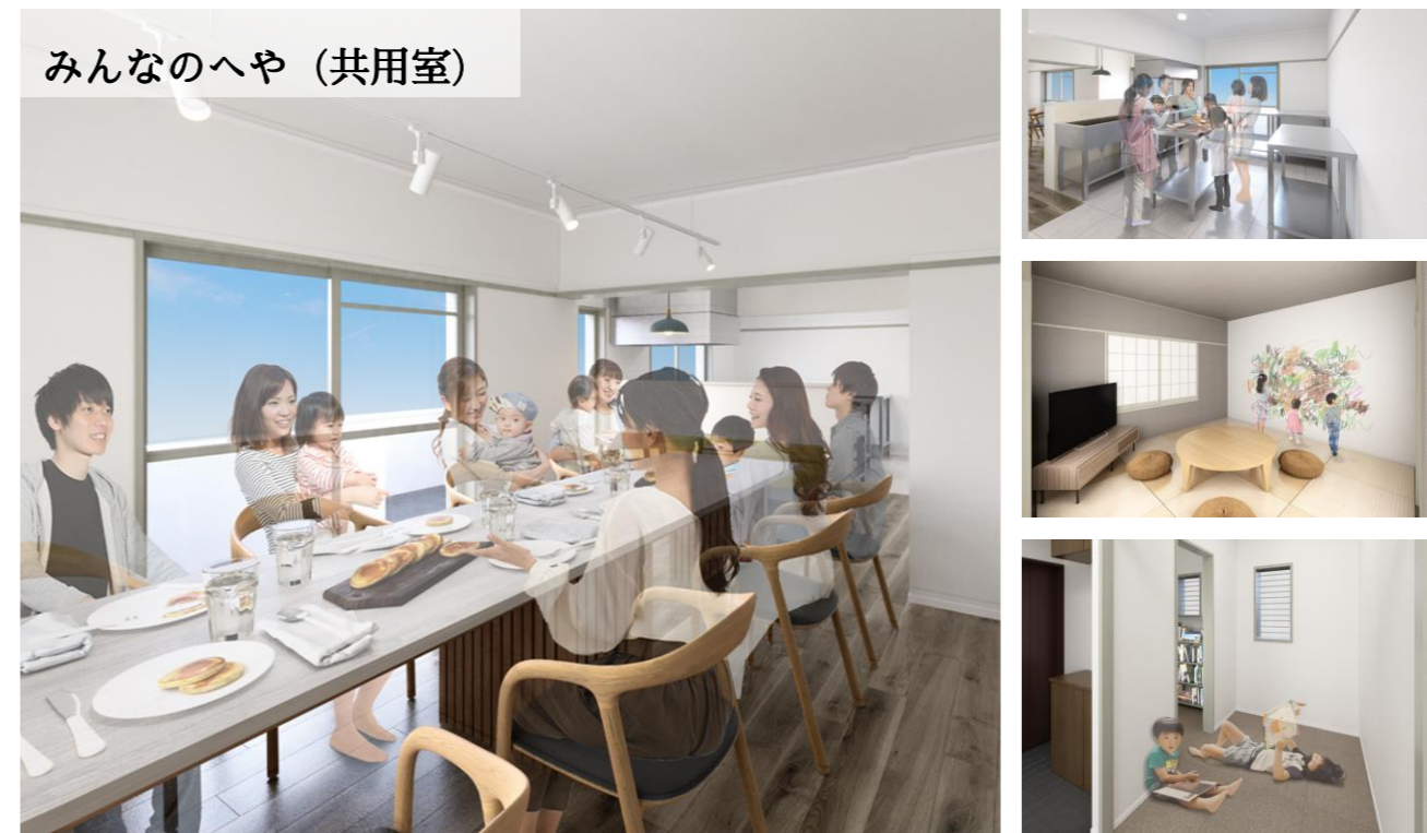
1室を共用部へと改修した「みんなのへや」は住民が使えるキッチンやリビング、図書コーナーを備えたコミュニティルーム