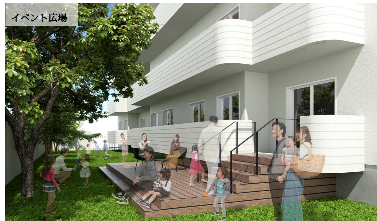
「みんなのへや」はウッドデッキを通じてイベント広場と繋がるフリースペース ここでは、定期的な屋外イベントの開催を予定