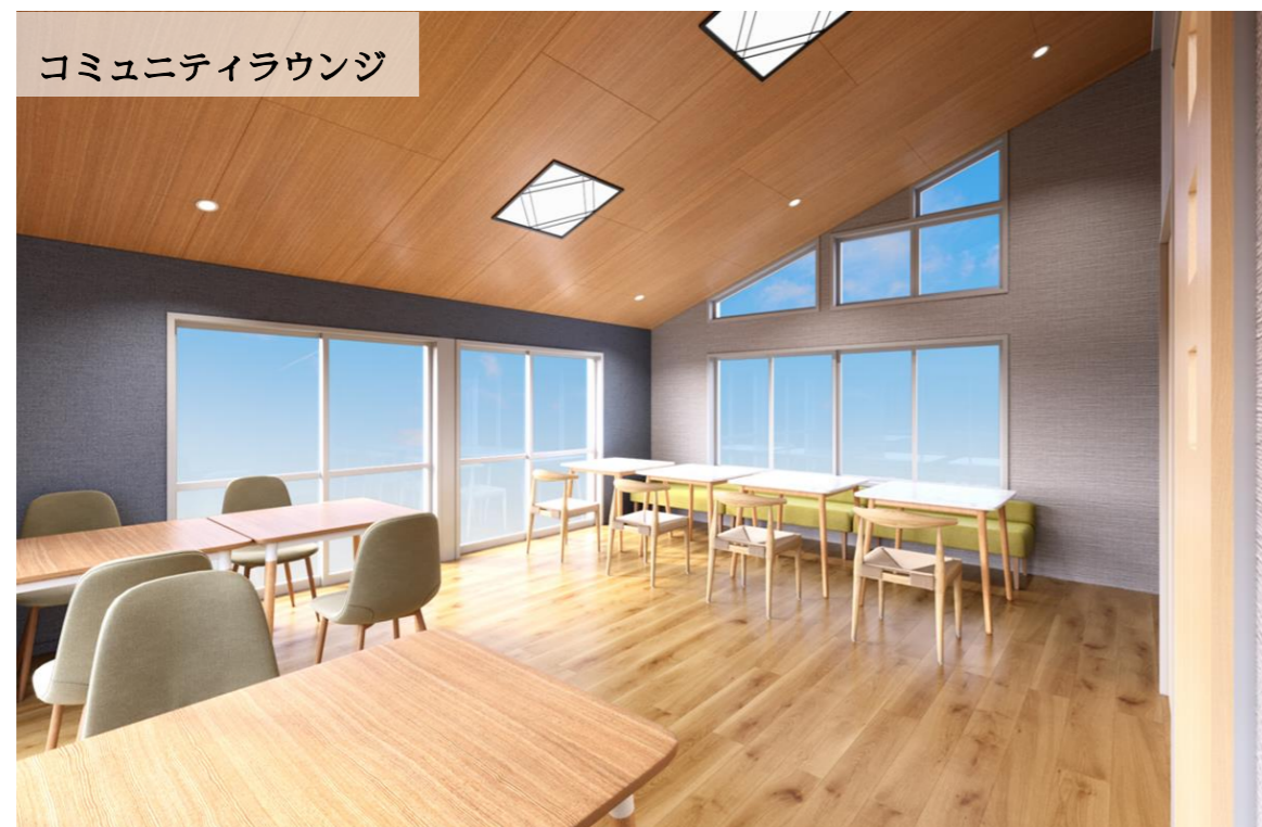
旧集会所を改修した「コミュニティラウンジ」はワークや勉強での利用可能 ここでは、定期的な室内イベントの開催を予定