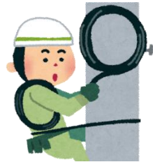
電気システム科 (1年間)