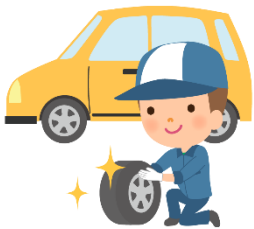
自動車整備科 (2年間)