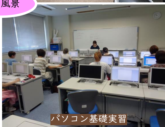
パソコン基礎実習