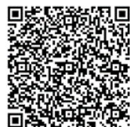
電子申請用QRコード