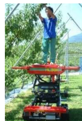
昇降機(高所作業車)