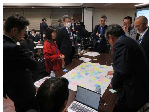
令和 6 年 11 月 11 日 教育懇談会