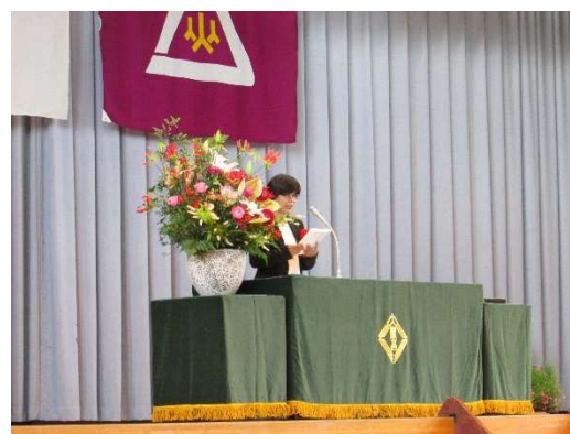
令和 6 年 6 月 3 日 農林高校創立 120 周年記念式典