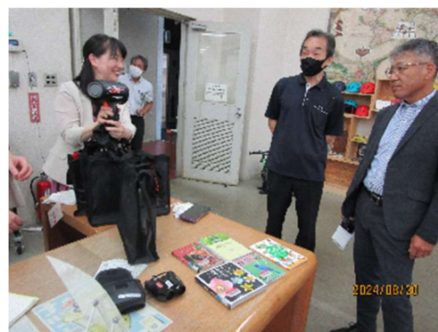
令和 6 年 8 月 29 日～30 日 1 都 9 県教育委員会教育委員協議会（視察）