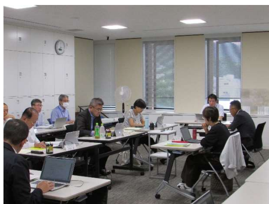
令和 6 年 7 月 11 日 第 7 回定例会