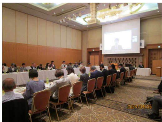
令和 6 年 4 月 25 日 1 都 9 県教育委員会全委員協議会（全体会）