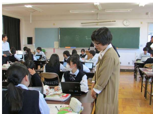
令和 6 年 10 月 21 日 がん教育公開授業（巨摩高校）