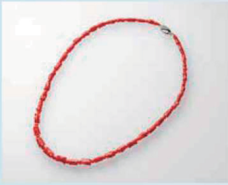
ネックレス gallery c