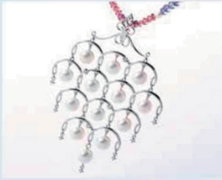
シャンデリア (株)中込宝飾