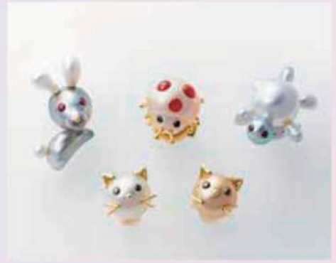
タックピン・ピアス (株)パールハンズ