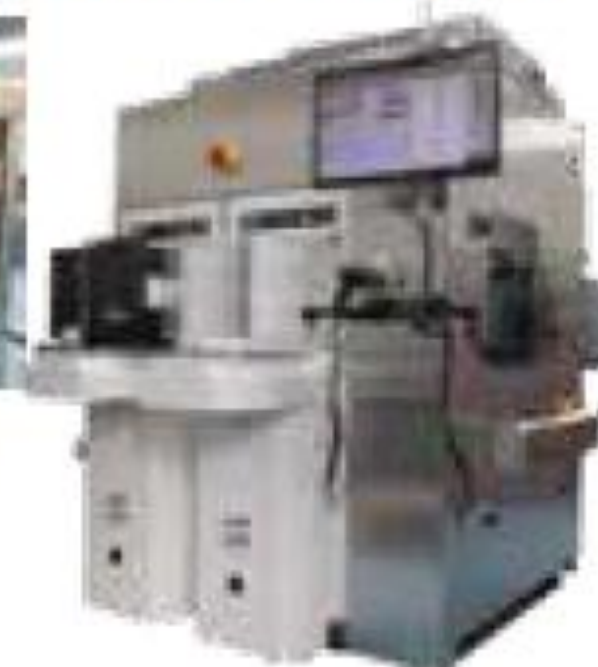
マクロ検査兼ウェハソーター