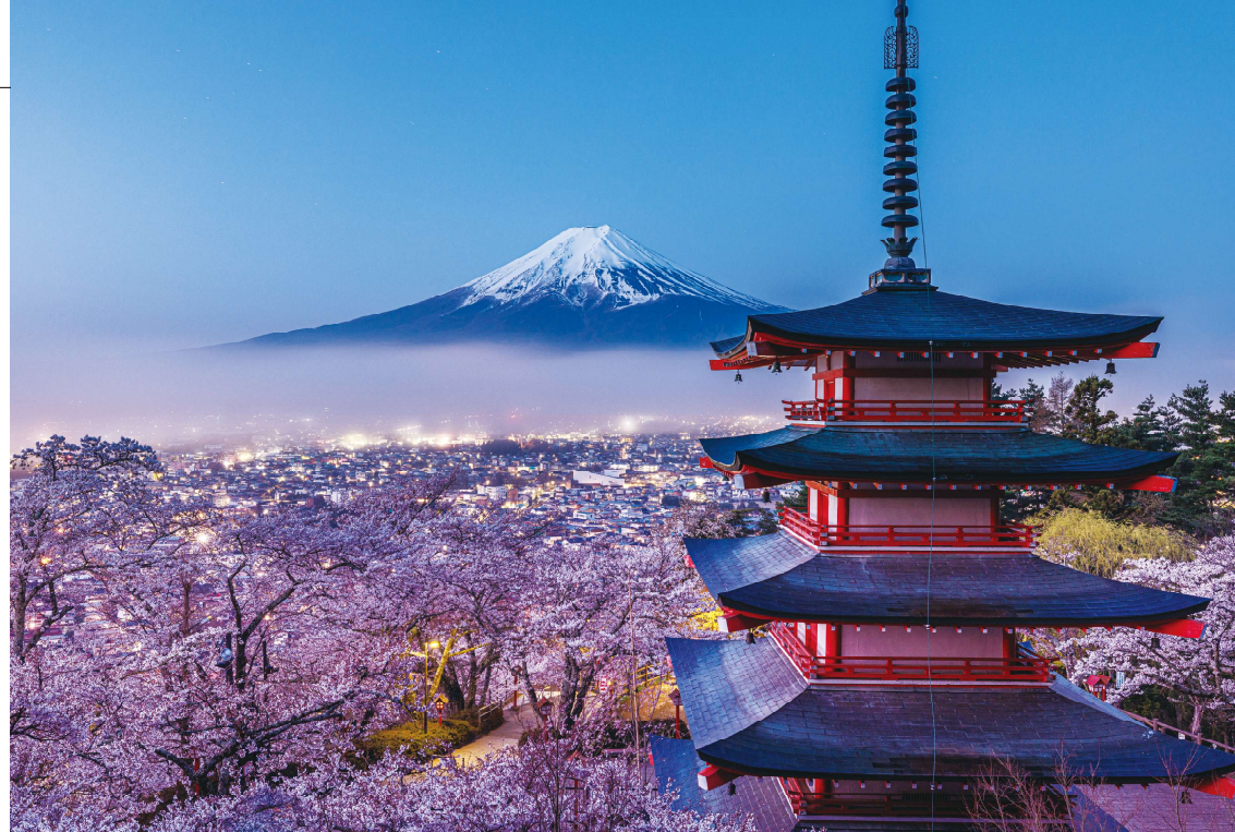
「桜に酔う峠」撮影場所：富士吉田市（やまなし世界遺産富士山フォトコンテスト 写真部門 銀賞作品）

このような富士山の歴史や文化にゆかりのある25の構成資産には、その山体だけでなく、周囲にある神社や風穴、溶岩樹型、湖沼などもあります。ユネスコ世界遺産委員会はこれらの価値を認め、未来に受け継ぐべき世界の宝として世界文化遺産への登録を決定したのです。