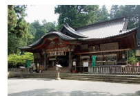
⑤北口本宮富士浅間神社

富士山信仰の聖地。富士講が富士登拝に出発すると、まずこの神社を参拝し、境内にある登山鳥居をくぐり富士山頂を目指しました。