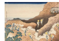
富嶽三十六景 諸人登山（葛飾北斎） 山梨県立博物館蔵

通称「赤富士」。凱風とは南風のことで、夏の朝、赤みを帯びた富士の山肌が日を受け、さらに赤く輝く現象が起こります。その一瞬を簡潔な構図と色彩で伸びやかに描いています。