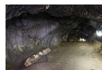
⑪船津胎内樹型 ※⑫吉田胎内樹型の内部は一般公開されていません

1768年に建てられた御師の家。御師は、富士登拝に訪れる富士講を迎え入れ、食事や宿泊の世話をするとともに布教活動も行い、富士山信仰を支えていました。