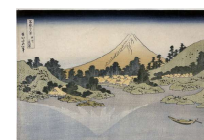
富嶽三十六景 甲州三坂水面（葛飾北斎） 山梨県立博物館蔵

つえを使って登る者、疲れて腰を下ろす者、岩室で休む者など富士山頂付近の富士講が描かれています。信仰の山としての富士山を主題にしていることが感じ取れます。