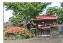
⑩御師住宅（旧外川家住宅） ※⑩小佐野家住宅は一般公開されていません

富士山信仰の聖地。富士講が富士登拝に出発すると、まずこの神社を参拝し、境内にある登山鳥居をくぐり富士山頂を目指しました。