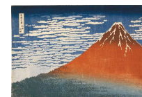
富嶽三十六景 凱風快晴（葛飾北斎） 山梨県立博物館蔵

通称「赤富士」。凱風とは南風のことで、夏の朝、赤みを帯びた富士の山肌が日を受け、さらに赤く輝く現象が起こります。その一瞬を簡潔な構図と色彩で伸びやかに描いています。