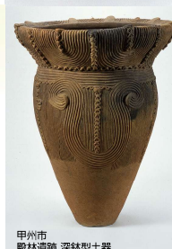
甲州市 殿林遺跡 深鉢型土器