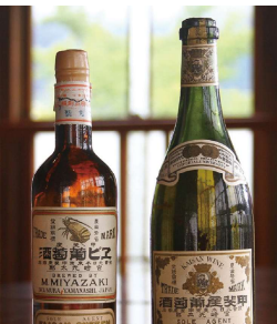
大黒天印甲斐産葡萄酒と甲斐産エビ葡萄酒