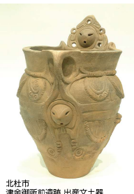
北杜市 津金御所前遺跡 出産土器