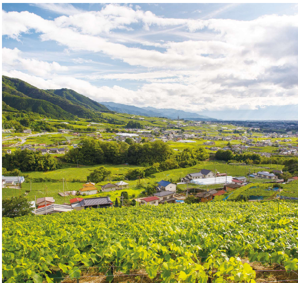
甲州市勝沼地域のフルーツライン付近から望むブドウ畑

奈良時代から始まったとも伝えられる葡萄栽培は、先人たちの知恵と工夫により、かつて水田や桑畑だった土地を一面の葡萄畑に変え、またその葡萄畑に育まれたワインは日常のお酒として地域に根付きました。今も歴史を語る技術や建物は受け継がれ、葡萄畑の風景の中に溶け込んでいます。