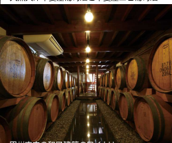
甲州市内の和風建築のワイナリー