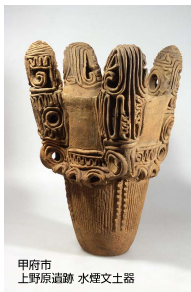
甲府市 上野原遺跡 水煙土器

麓のムラで作られた、ヒトや森に生きる動物を描いた土器やヴィーナス土偶を見ると、縄文人の高い芸術性に驚かされ、黒曜石や山の幸に恵まれて繁栄した縄文人を身近に感じることができます。