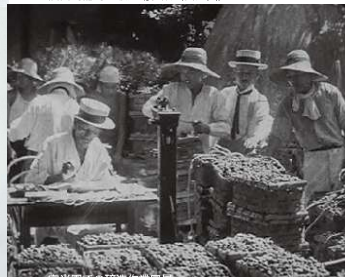
宮光園での醸造作業風景