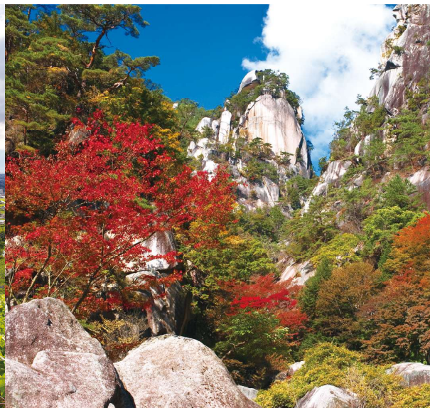
巨岩や奇石などを有し、希少な造形美を形成する昇仙峡