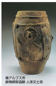
南アルプス市 鉢物師屋遺跡 人体土器