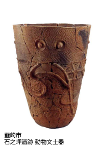
韮崎市 石之坪遺跡 動物土器