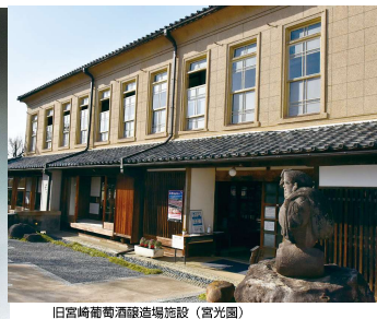
旧宮崎葡萄酒醸造場施設（宮光園）