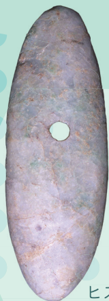
ヒスイ製大珠 (大月遺跡出土)