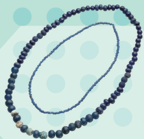
ガラス玉(左)、トンゴ玉(右)(平林2号墳出土) ※山梨県指定文化財

数ある装飾品のなかでもひと際美しい玉製の装飾品。これらは、身を飾るという意味だけでなく、持つ人の立場の象徴や、呪術的な意味合いを持っていたと考えられます。