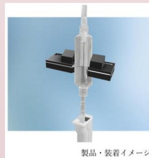
製品・装着イメージ

応募内容:医療現場において点滴筒に装着。赤外線センサーで輸液剤の滴下を監視し、滴下異常や終了の際にアラームで通知する小型のデバイス。