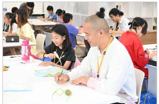
※講座内容は今年度と異なります。