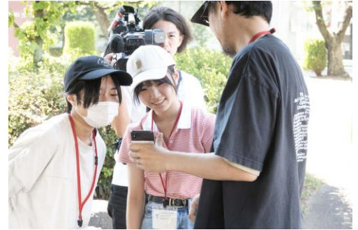
※講座内容は今年度と異なる可能性があります。