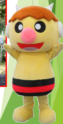
企業局イメージキャラクター「ゴロン太くん」