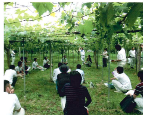
農業者やJA、県職員による現地検討会