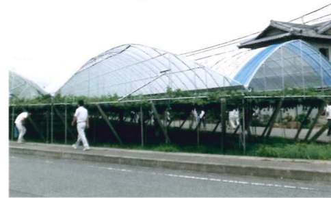
スーパー低コストサイドレスハウス