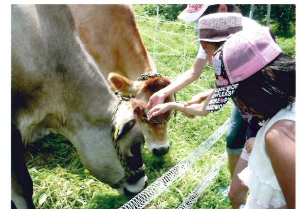
子供たちもお気に入り