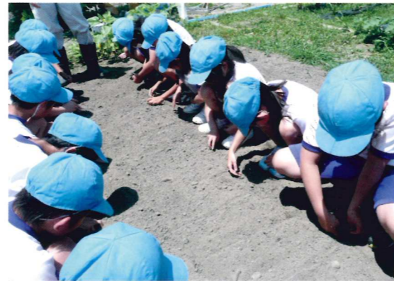
「ひと粒入魂？」みなさん真剣です