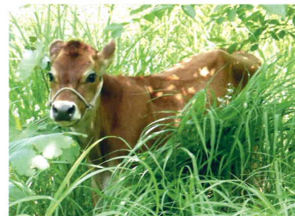
除草対策で活躍中