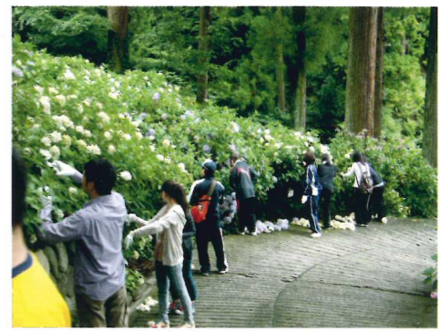
剪定作業に多くのみなさんが参加

今後は、剪定ボランティア活動だけではなく、苗植え付けボランティア活動などを計画しています。他地域との交流をさらに推進し、まずはあじさいやゆずをきっかけに小室地区を知ってもらい、年間を通して小室に人が来てくれるようなメニューを企画し、活気ある地域になるよう活動していきます。