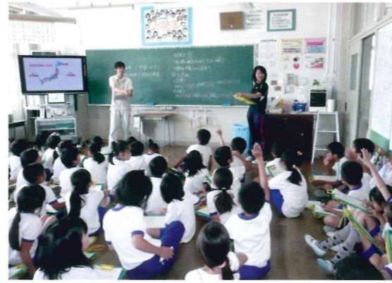
みんな大豆はかせになれそうです

今後は、これらの収穫体験を通じ、自ら育てた農作物を収穫する喜びとその利用方法に至るまでを理解してもらうことで、自分の住む地域で行われている農業生産活動に目を向けて、将来の担い手として地域に定着してくれることを期待しています。