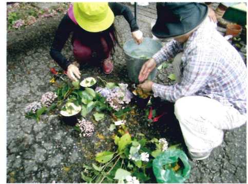
多くの品種を守り増やしていきます