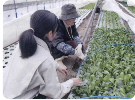
冬野菜の作型や品種を紹介しました。 直売所では大人気との声も

中北地域普及センターでは、一年を通して栽培講習会の開催を支援していますが、近年、冬野菜をテーマにした指導依頼が増えてきました。2~3月の時期は県産野菜が少なくなるため、出荷品目の拡大が求められています。