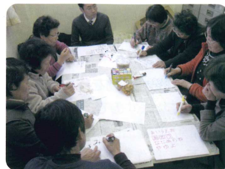
POP作成のために書き方の練習をしています