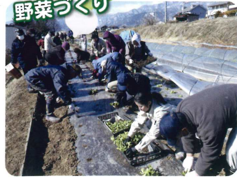
生産者団体の展示ほで、 早春レタスの講習(甲斐市)