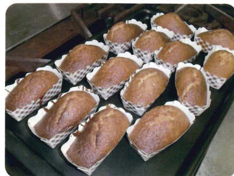
焼き上がった試作マフィン