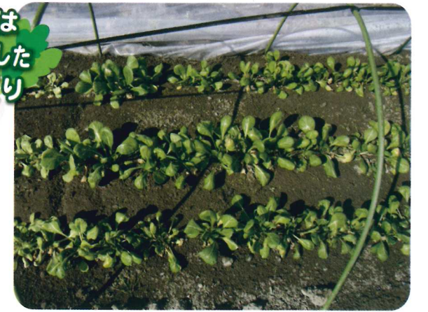
1重トンネルのコマツナ (11月20日播種1月10日撮影)の生育状況