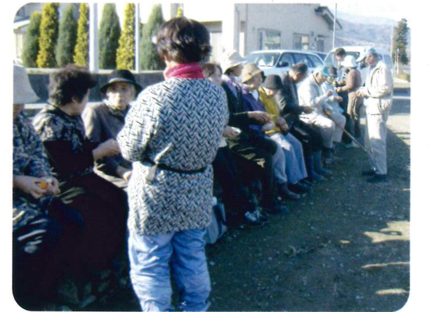
講習会に集まった生産者組織の皆さん (富士川町天神中条地区)