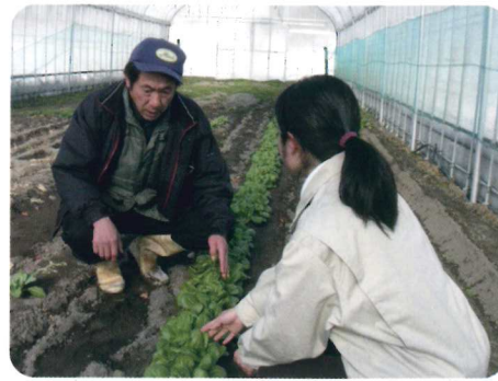
農事組合法人で冬野菜の試作を行いました