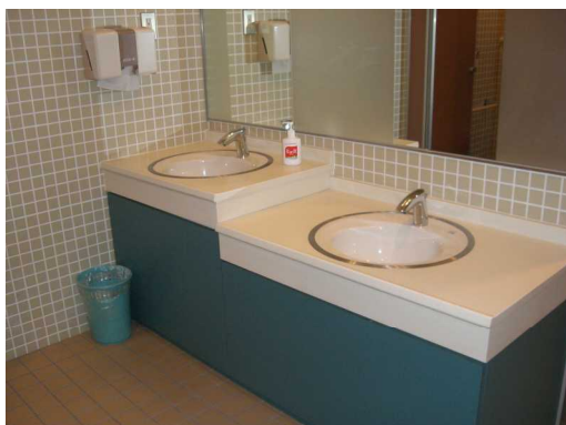
高さを工夫した洗面台 (あけぼの医療福祉センター)