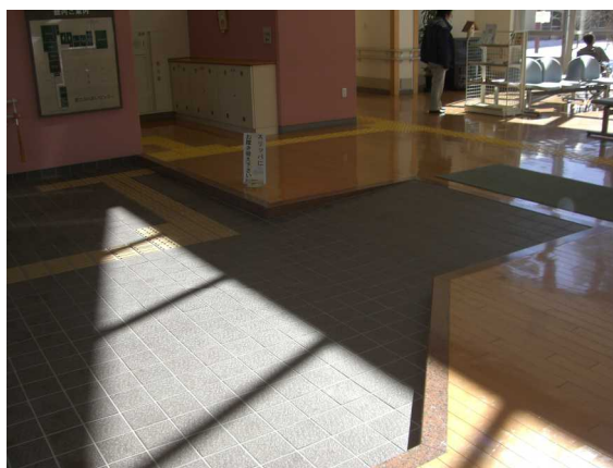
スロープによる段差の解消（富士ふれあいセンター 玄関）