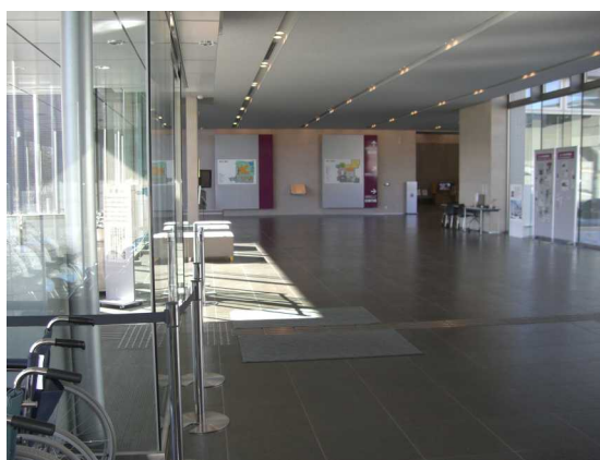
わかりやすいよう見通しを確保したエントランスホール （県立博物館）