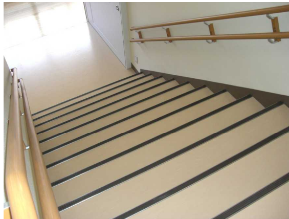
安全性に配慮した階段の手すり (甲府支援学校)