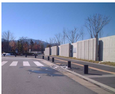
歩行者と自動車の経路の分離 (県立博物館)