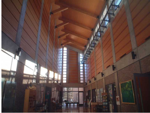
高窓による明るく見やすい光環境 (環境科学研究所)