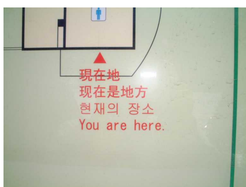
複数の外国語による案内表示 （富士ビジターセンター）