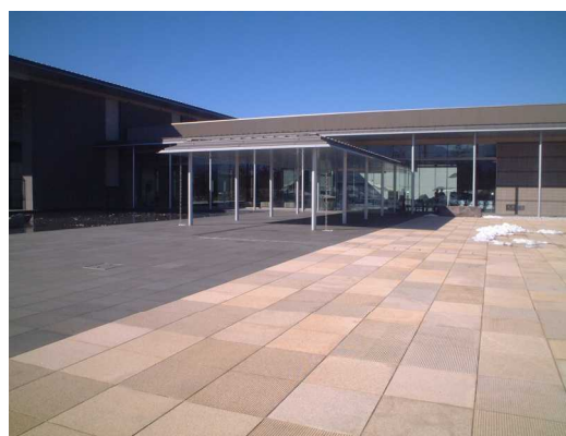
滑りにくく平坦な床仕上げ (県立博物館)