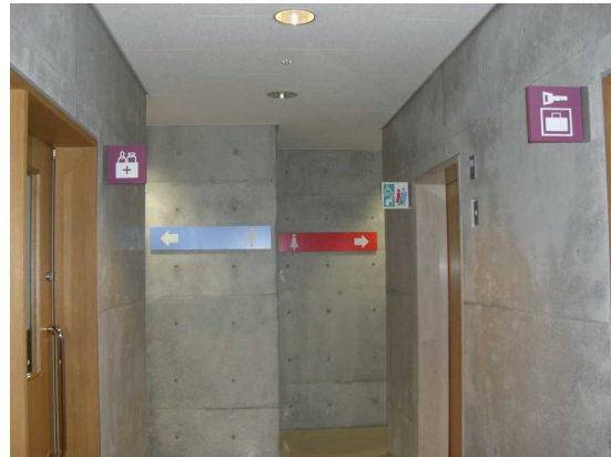
落ち着いた見やすい色彩計画(県立美術館)