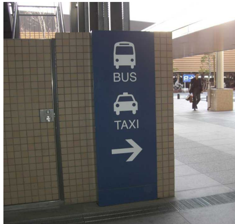
わかりやすいサイン計画（県立中央病院）