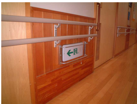
見やすい位置に設置し安全に配慮した誘導表示（ふじざくら支援学校）