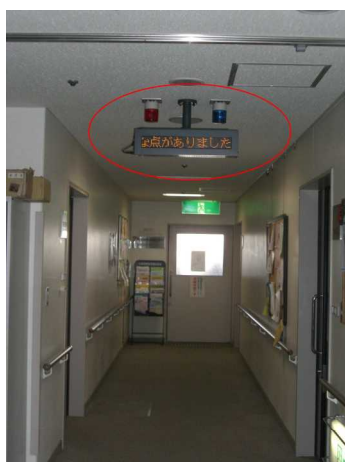
電光表示による文字情報（福祉プラザ）