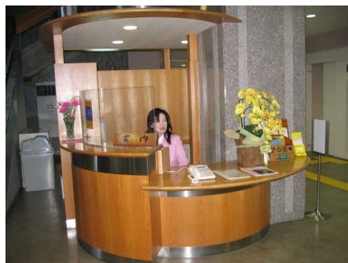
高さを工夫した受付カウンター (県庁本館)