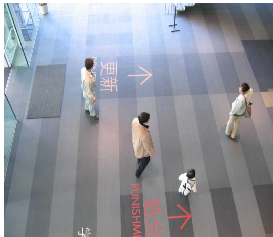
わかりやすい案内表示（総合交通センター）