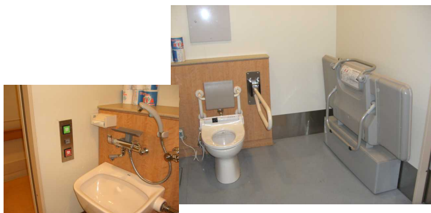
オストメイト対応の多目的トイレ (県立中央病院)