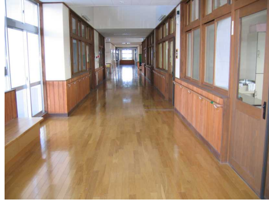
木材の使用によるあたたかみのある空間の確保 (甲府支援学校)