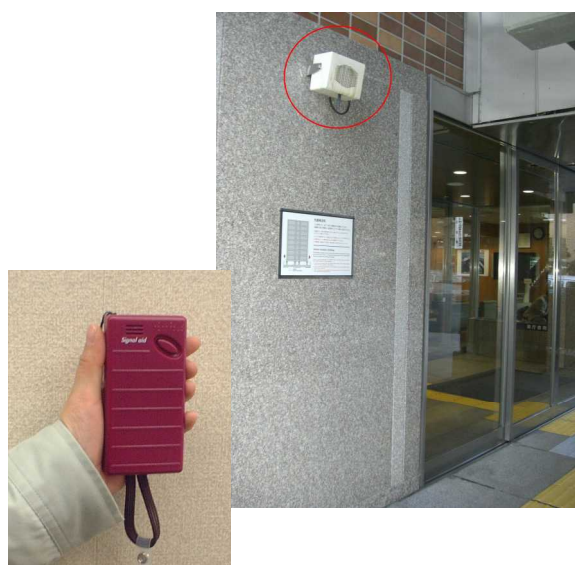
発信機による音声誘導案内（県庁本館）