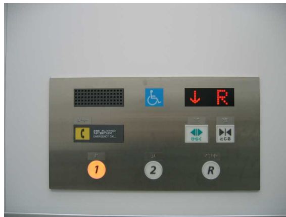
スイッチ類を工夫したエレベーター内部 (あけぼの医療福祉センター)