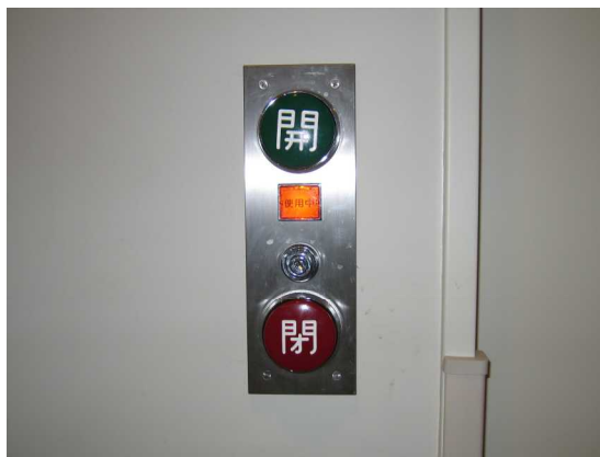
大きくて操作しやすいボタン（あけぼの医療福祉センター）