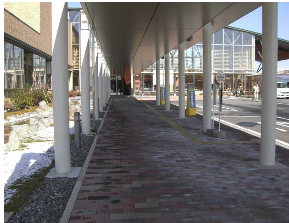
段差のない歩行者用通路（あけぼの医療福祉センター）