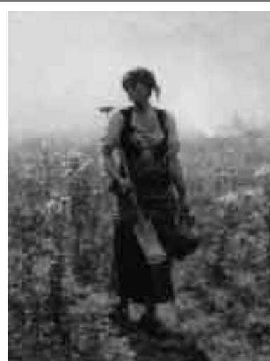
ジュール・ブルトン 《朝》

若い頃のミレーに特徴的な小画面の作品で、家庭内の女性の労働を描いています。2番目の妻をモデルにしたと言われており、ミレーが晩年まで繰り返し描き続けた「お針子」という画題の中の初期の秀作です。