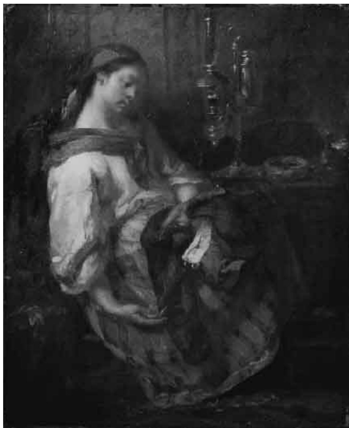
ジャン=フランソワ・ミレー 《眠れるお針子》

30周年を機に、より魅力的に生まれ変わった県立美術館で、「ミレーの世界」をご堪能ください。