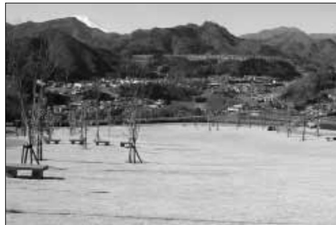
▲芝生広場/樹木やベンチを配置し、四季の変化を楽しんだり、さまざまなイベントに利用できる憩いの広場です。