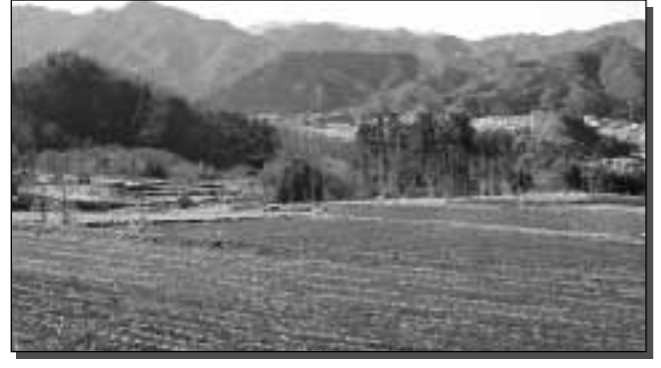
▲菜園/ハーブなどに触れることができるほか、農産物の収穫を体験できます。