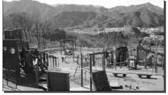
▲遊びの庭/親子が触れ合い、子どもたちが遊ぶことができます。木製遊具や長さ15mのローラー滑り台もあります。