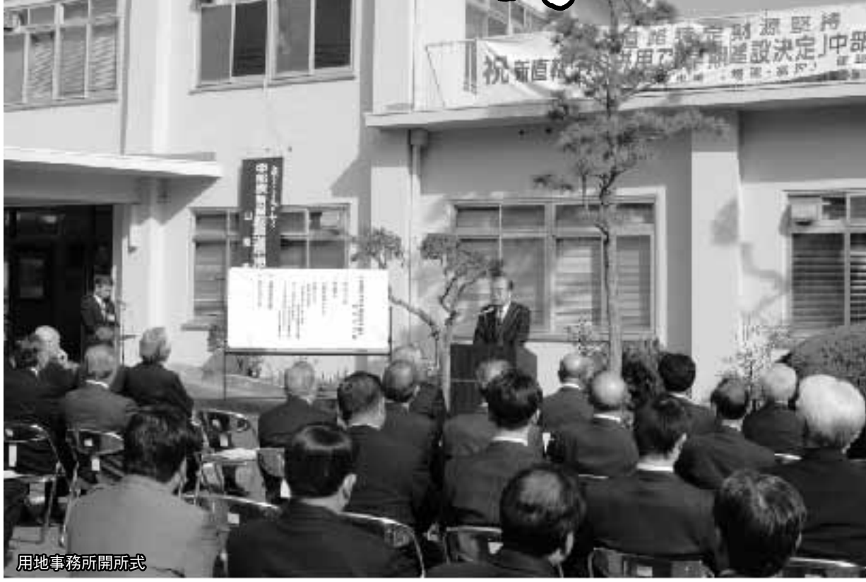
用地事務所開所式