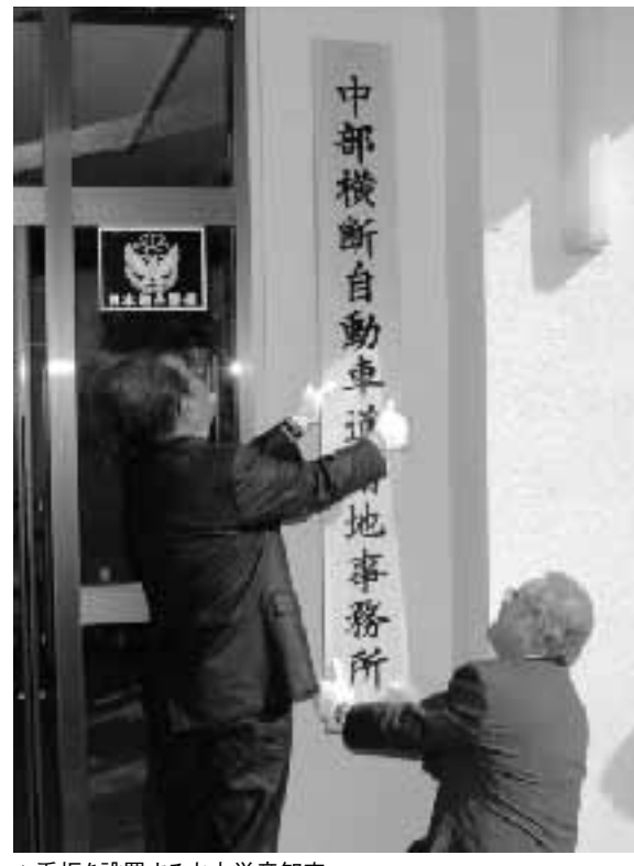
▲看板を設置する山本崇彦知事