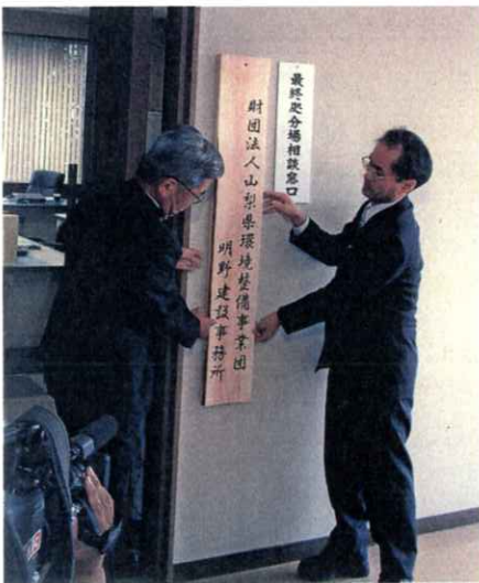
(明野建設事務所開所式)