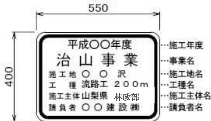
図2-1 (単位: mm)