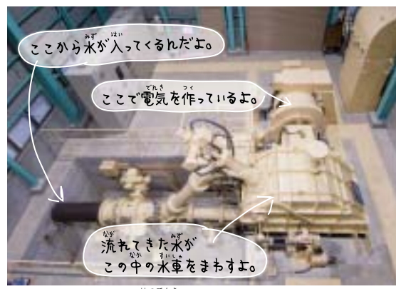
琴川第三発電所の「発電機」

ていて、太陽の力で水蒸気になり、また雨になって戻ってきます。自然の中でぐるぐる回っている水を利用した水力発電は、いつまでも使い続けることができます。 でも、水から電気を作するためには、川に水がたくさん流れていることや、水の流れが強いことが必要だから、どこでもできるわけではありません。 水を蓄える森がいっぱいあって、水が勢いよく流れる高い山もたくさんある、自然に恵まれた山梨だからできる電気の作り方です。 県内で水力発電により電気を作りはじめたのは100年以上前ですが、今日も君の家や学校で使う電気を作り続けています。