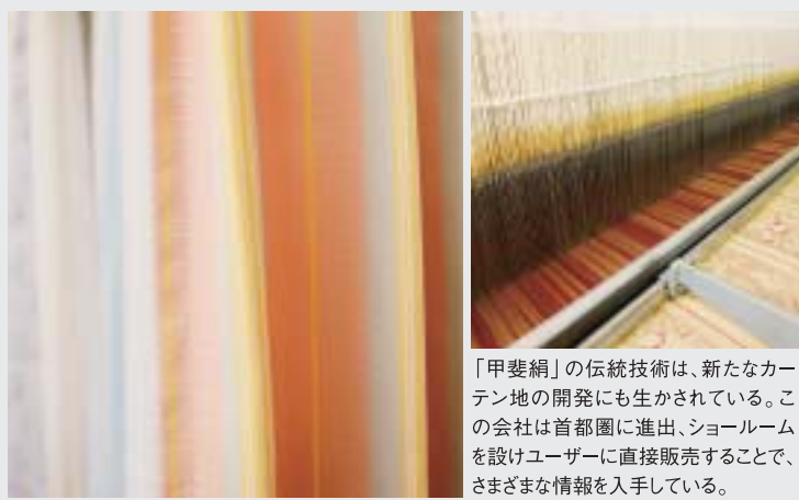
「甲斐絹」の伝統技術は、新たなカーテン地の開発にも生かされている。この会社は首都圏に進出、ショールームを設けユーザーに直接販売することで、さまざまな情報を入手している。

は、先染め、細番手、高密度など伝統的な「甲斐絹」の特性を生かして、その美しさを現代によみがえらせた新しい織物だ。 組合としても積極的な商品開発が進んでいる「ふじやま織」は「ジャパン・テクス2007」「ジャパン・クリエーション2008」「東京インターナショナルギフト・ショー春2008」など、都内で開かれる大きな展示会でも活発なブランド展開を続けている。絹100%の純白の薄絹羽衣掛ふとん「十重二十重」や伝統的な和柄を大胆に使ったエコバッグなど、すでに会場で大人気を博した商品もある。またカーテン地や傘地など、かつては生地だけを提供していた各企業も、製品化から販売まで自社で積極的に進めている動きも注目されている。本来の「甲斐絹」の美しさを