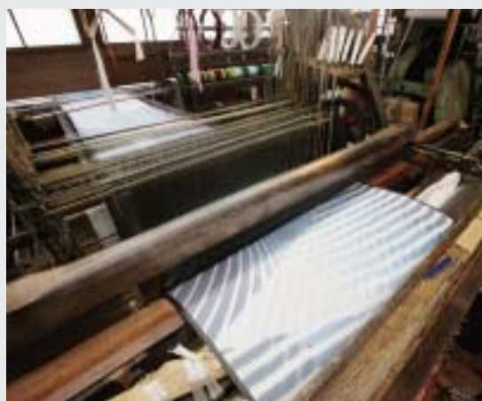
「甲斐絹」の伝統を継ぐ「ほぐし織」は、機械化されてもやはり手間がかかる。大量生産とコスト競争の時代が終わり、今では吉田地域ならではの高級傘地として人気がある。商品化され直接市場に出回ることも普通になった。

知っているからこそ、多くの人に愛用してもらいたいと、オリジナルのデザイン開発にも熱が入る。これらの産地の取り組みを支えているのが、県富士工業技術センターの存在だ。明治38年、県工業試験場として設置されて以来、産地の特色である先染め工程での新技術の開発やデザインのソフト開発など織物業者と一体となった研究が続いている。 「甲斐絹」で培った技術と格調高いデザインを生かした郡内の織物。「やまなしブランド」の確立に不可欠な産業として、全国に、いや世界に進出する姿勢が楽しみだ。