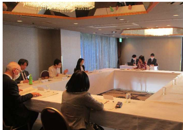
令和 5 年 4 月 27 日 1 都 9 県教育委員会全委員協議会