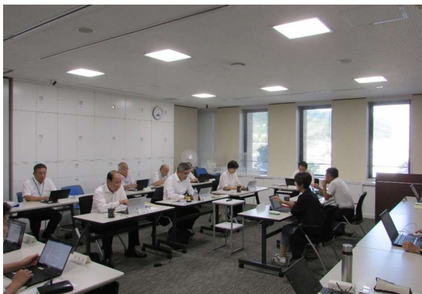
令和 5 年 9 月 13 日 第 8 回定例会