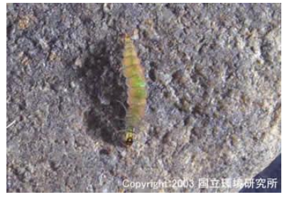
NO.3 ナガレヒメケラ類