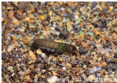
NO.12 オシマトヒメケラ