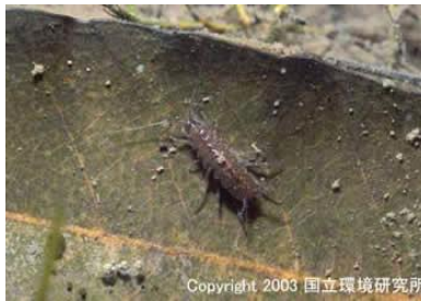
NO. 20 ミズムシ