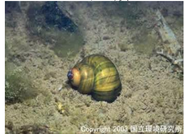
NO. 21 タニシ類