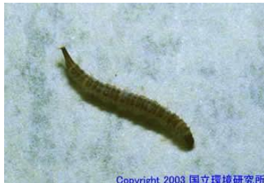
NO. 26 チョウバエ類