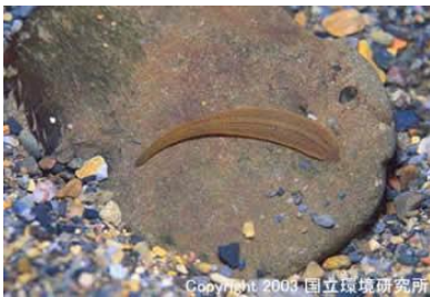
NO. 22 シマイシル