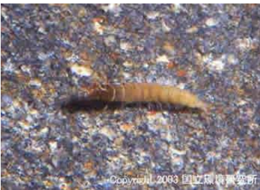
NO.11 コガタシマトヒメケラ類