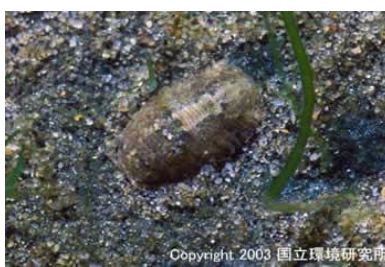
NO. 23 イソコツブムシ