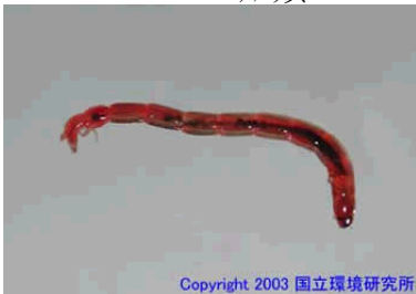
NO. 25 ユスリカ類