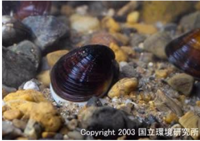
NO. 17 ヤマトシジミ