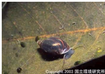
NO. 28 サカマキガイ