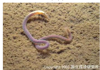
NO. 27 エラミズ