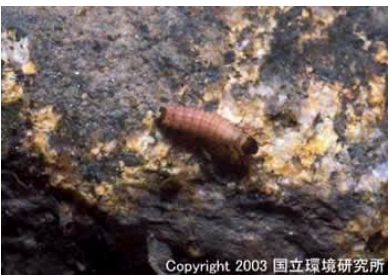
NO.4 ヤマトヒメケラ類