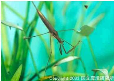
NO. 19 ミズカマキリ