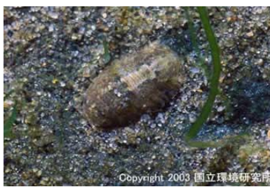
NO. 23 イソツブムシ