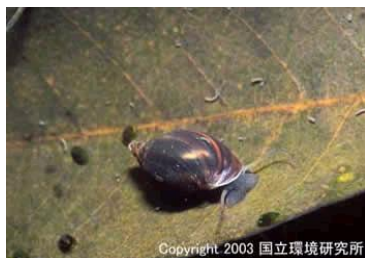
NO. 28 サカカガイ