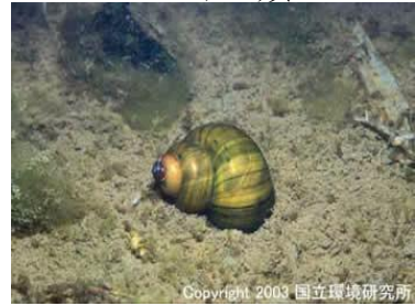
NO. 21 タニシ類