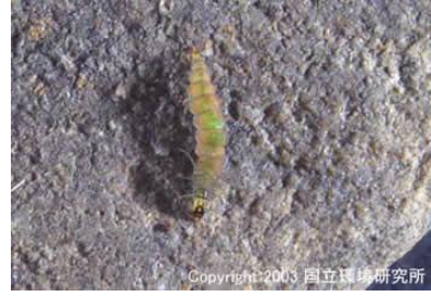
NO.3 ナガレヒゲケラ類