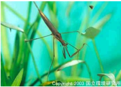
NO. 19 ミズカマキリ