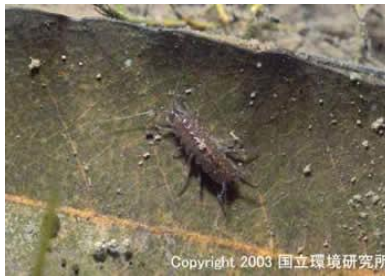
NO. 20 ミズムシ