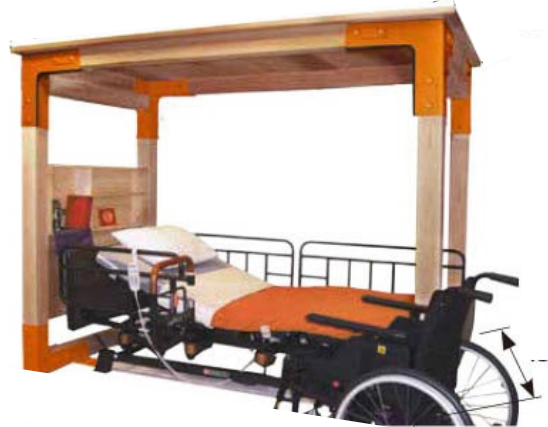
介護ベッド用シェルター