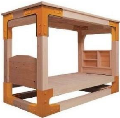
シングルサイズ用