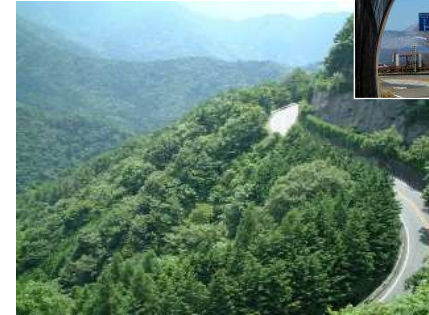
つづら折りの国道300号

大型観光バスが反対車線にはみ出さないと通行できない急カーブが続き、道路改良等の検討を進める。