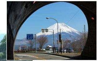
中之倉トンネル出口付近