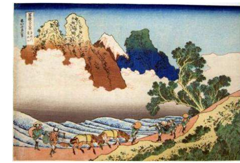
葛飾北斎 富士三十六景 身延川裏不二 (県立博物館蔵)

門内エリアの道路整備とともに、景観形成について検討を進めて、身延山の魅力を更に高め、国内外に情報発信する。