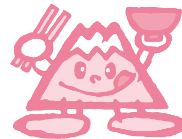
やまなし食育推進マスコット ふじべろりん