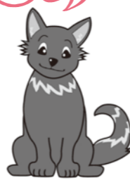
見守り犬 「かい」くん