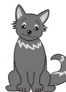
見守り犬「かい」くん

詳しくは山梨県県民生活センター 055-223-1571までお問い合わせください。