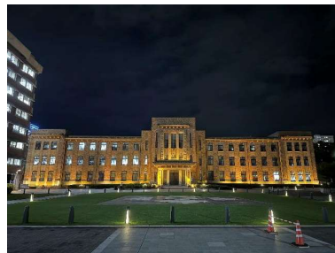
県庁別館ライトアップの様子

7月は再犯防止啓発月間・社会を明るくする運動強調月間となっており、県では今年度も様々な事業を実施しました。例年実施している県立図書館との連携展示やヴァンフォーレ甲府ホームゲームにおけるオーロラビジョンでの広報、啓発を実施しました。また、その他には山梨県庁別館の南側を更生保護のシンボルカラーである黄色にライトアップを実施しました。