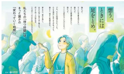
犯罪や悪行を防止し、立ち返りを変える地域のチカラ 第74回 社会を明るくする運動