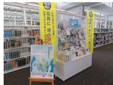
県立図書館の連携展示の様子