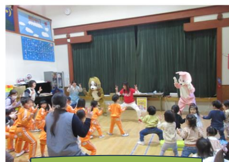
健康・安全・郷育プログラム