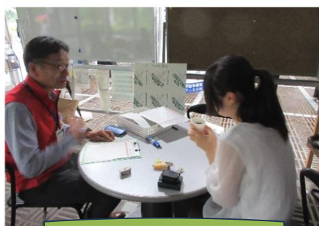
コミュニティカフェ