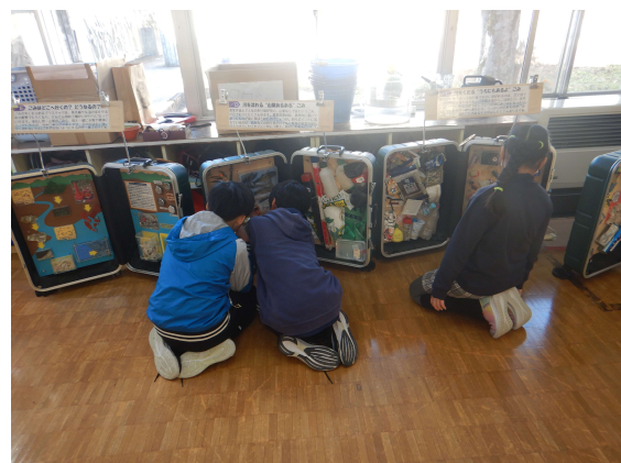
●環境学習会の様子