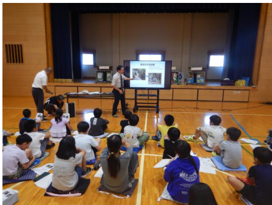
環境学習会の様子

監視指導を強化しているものの、廃棄物の不法投棄は依然として繰り返されており、根本的な解決に至っていません。このため、児童期からの環境教育を充実させることで、将来的な県民意識の向上を図ることを目的とした廃棄物の適正処理学習会を、令和7年10月17日に身延町立下山小学校で実施しました。4年生と5年生の33名に参加いただき「不法投棄がなぜ起こるのか」「どうしたら不法投棄は防ぐことができるか」「私たちができることはなにか」を考えてもらい、多数の意見が出されました。