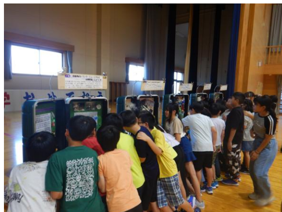
トランクミュージアムで学ぶ様子