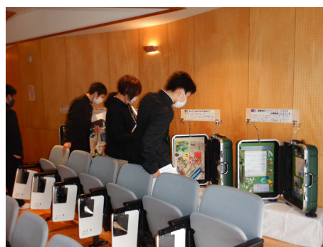
●環境学習会の様子②