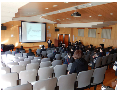
●環境学習会の様子①

受講した生徒からは、「不法投棄をしないでごみを分別して捨てるようにする」、「私も江戸時代のように、ものを大切に使いしていきたいと思った」などの感想がありました。