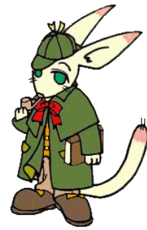
山梨県立図書館キャラクター 本探偵ジッポ・ホンムズ1世