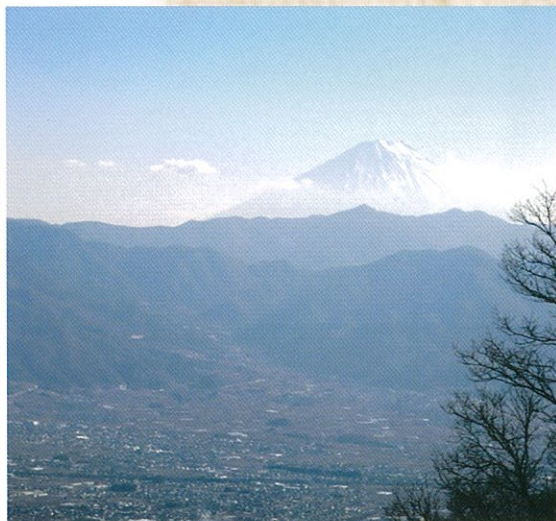
展望台からの眺め