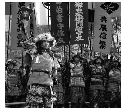
「信玄公祭り」(4月9日~11日)