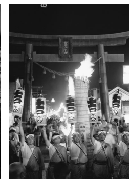
「吉田の火祭り」(8月26日) (県指定民俗文化財「日本三奇祭の一つ」)