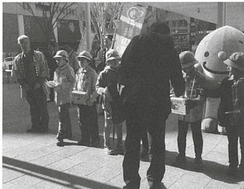
街頭緑化キャンペーン