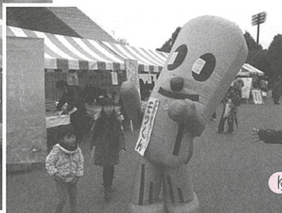
ゆるキャラにも協力してもらいました

今年は、パルシステム山梨 のこんせんくん、(公社)や まなし観光推進機構の武田 菱丸、山梨県のモックンな ど、多くのキャラクターもパ レードに参加し、注目度も抜 群でした。