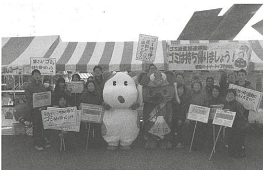
参加した皆様と記念撮影

県民の日記念行事が、ゴミの出ないイベントとなるように、ゴミ持ち帰りのためのキャンペーンとして、両日も午後2 時30分から約30分、ゴミの持ち帰りパレードを行いました。2日間で延べ60名の方が参加して、手作りのプラカード や横断幕を持ちながら来場者にごみの持ち帰りやごみの減量などを呼びかけました。