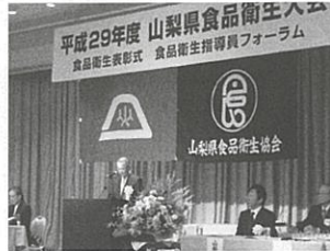
平成29年度 山梨県食品衛生大会