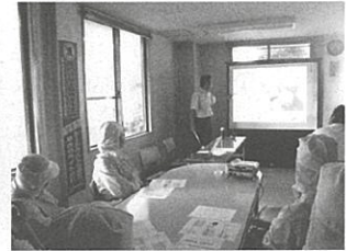
食品営業施設での 衛生講習会