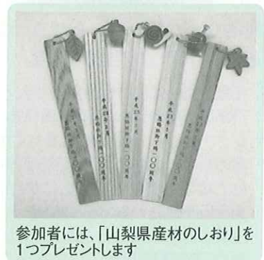
参加者には、「山梨県産材のしおり」を1つプレゼントします