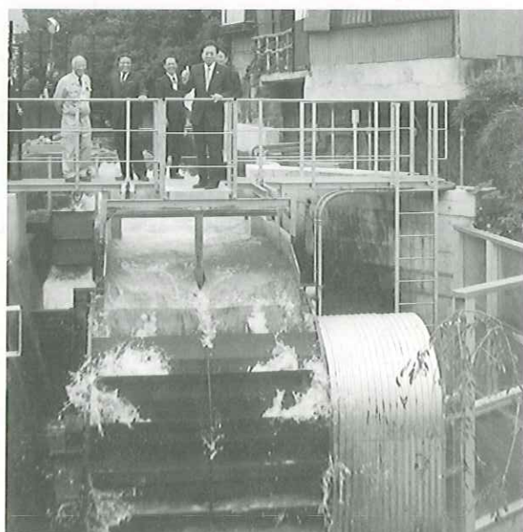
家中川小水力市民発電所「元気くん2号」