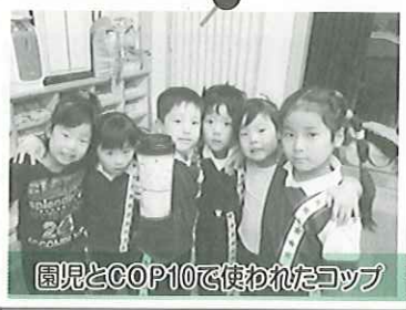
園児とCOP10で使われたコップ