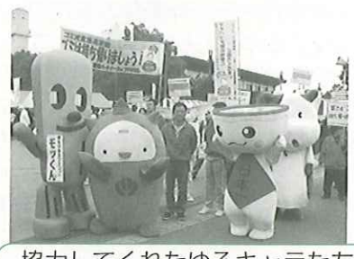
協力してくれたゆるキャラたち