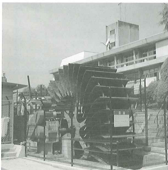
家中川小水力市民発電所「元気くん1号」