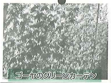
ゴーヤのグリーンカーテン