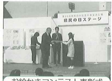
お絵かきコンテスト表彰式

また、会場内では「マイバッグ・マイはし・マイボトルお絵かきコンテスト」の表彰式や、入賞作品の展示も行いました。