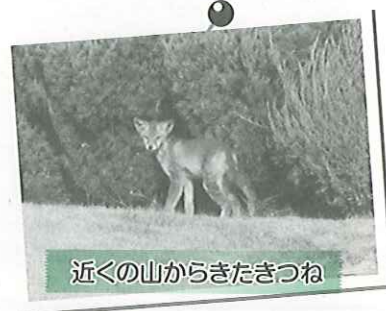
近くの山からきたきつね

また最近では、「生物多様性」をテーマに名古屋で国際会議COP10が開催されましたが、子ども達が描いた生物多様性をテーマにした絵が、会議で使用されたコップに写真のように使われました。実際に会議で使ったコップを頂きました。子ども達の環境への想いが会議に参加した大人達に伝わったことと確信しています。これからも地球環境を大切にしていくなを子ども達の中に育てていきたいと思っています。