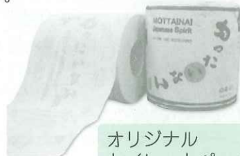
オリジナル トイレトペーパー