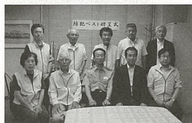
(8月8日)上野原警察署での「ふれあい連絡会」へのベストの贈呈(署長室にて)