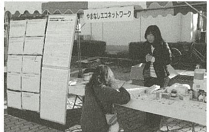
県民の日(小瀬会場)による、山梨の10大環境ニュース等投票の様子

最後になりますが、例年11月の県民の日には、小瀬の会場でブースを開いています。山梨県の環境10大ニュースの投票や環境関係のゲームや活動の紹介をおこなっています。