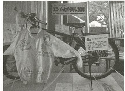
「ストップ!地球温暖化エコリレー山梨」で使用した自転車

これまで、地球温暖化防止を軸に、自然と人が共生した持続可能な社会を作るために、山梨県下で、"地球規模で考え地域から行動する"ための具体的な提案と実践活動、タイムリーな情報の受発信を、広く県民の皆様とともに行っていきたくと活動しています。