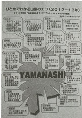
市町村持続可能社会づくりアンケートをマップしてまとめ配布

県内では、市町村を対象に、今年で19回となる、市町村「持続可能社会づくり」アンケートとヒヤリングを実施しています。それぞれの市町村のいろいろな取り組みの中から、他の市町村の先進的な事例となるような施策を拾い出し、「ひとめでわかる山梨のエコ」としてまとめています。この結果は、市町村へ情報提供するとともに、報道関係へも公表しています。