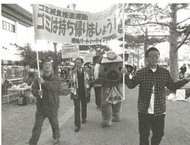
昨年度のパレードの様子

また、県民の日記念行事が、ゴミの出ないイベントとなるように、ゴミ持ち帰りキャンペーンとして、両日午後2時から3時にかけて、ゴミの持ち帰りを呼びかけるパレードを実施します。多くの会員の皆様のご参加をお願いします。