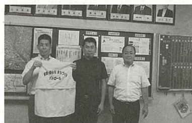
(9月10日)甲府市立国母小学校へのベスト贈呈(校長室にて)

この度、「環境パートナーシップやまなし」の入会については、環境対策部会が中心となり各会員に呼びかけ入会する事となりました。私達が販売した商品・製品の「空缶・ペットボトル」の散乱を防ぎ「資源の再利用」を目的としています。