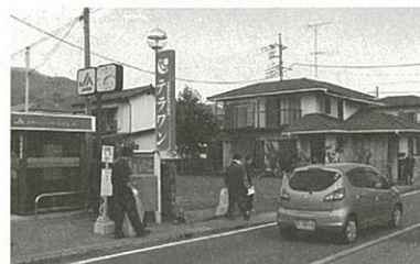
(有)テラワン(会長の会社)での朝礼前の空缶、ゴミ拾いです。