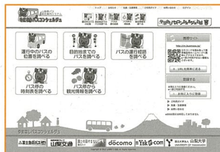
やまなしバスコンシェルジュ http://busmaps.jp/yamanashi/