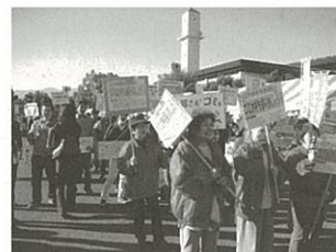
延べ100名の方が参加しました