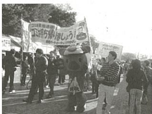
ゆるキャラにも協力してもらいました

今年も、パルシステム山梨のこんせんくん、(公社)やまなし観光推進機構の武田菱丸、山梨県のモックン、笛吹市のフッキー、甲府昭和高校のトライスなど、多くのキャラクターもパレードに参加し、注目度も抜群でした。