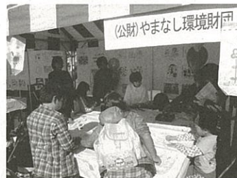
お絵かき大会の様子