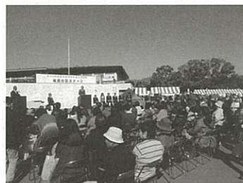
出席者が150名を超す大規模な表彰式となりました