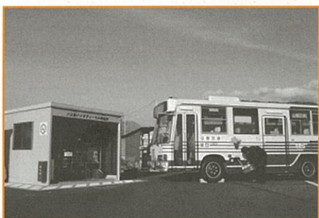
バイオディーゼル燃料 BDF製造プラントとバス

また、安全と快適なサービスの提供に努め、環境にやさしい公共交通の利用促進及び活性化を目指します。