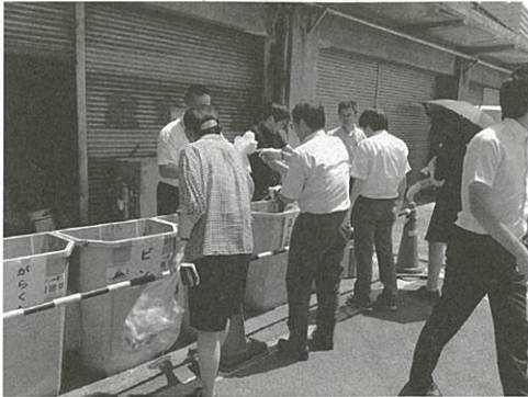
キャンペーンの様子（県庁）

やまなしクリーンキャンペーンは、環境パートナーシップやまなし・山梨県・市町村が、県民参加による環境美化のための一斉活動日を提唱し、全県一斉クリーンキャンペーンを展開するもので、平成25年度は年間で444団体、延べ555,114人が活動を実施しました。