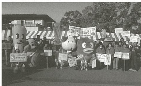
参加した皆様と記念撮影